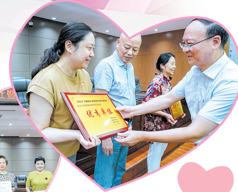
为来到现场的爱心人士、优秀单位代表颁发荣誉证书、牌匾。