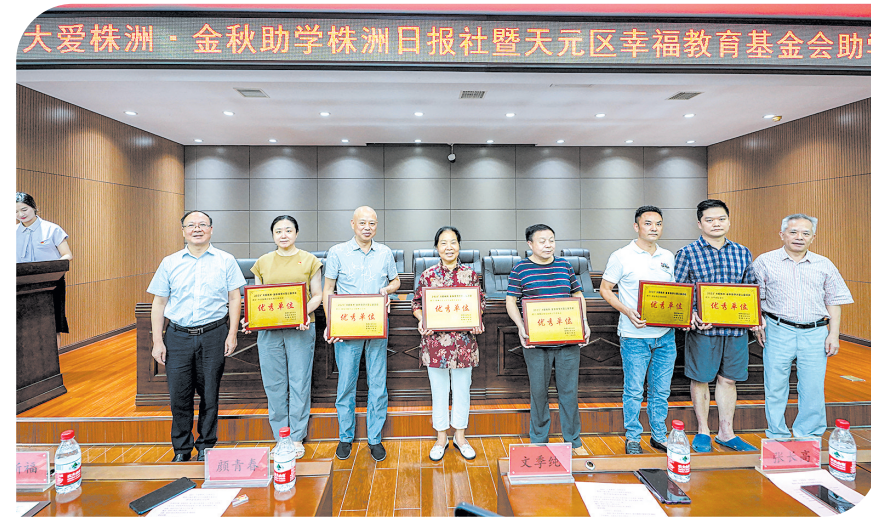
为捐助助学先进单位颁发荣誉牌匾。