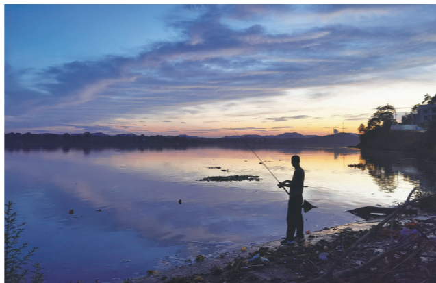
晚霞中的昭陵。

没有专业摄影师的精准构图，手机像素或许也不够高清，但参与这场活动的人们，却怀着对家乡的爱和真心，透过一张张笑脸、一个个场景，勾勒了宜居、宜业、宜游的和美乡村的生动模样，也让更多人明白，在乡村振兴战略的加持下，我们看得见青山绿水，留得住美丽乡愁，不必羡慕诗和远方。