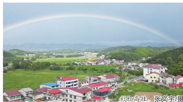
彩虹高挂。