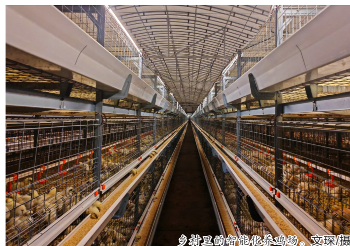
乡村振兴的智能养鸡场。