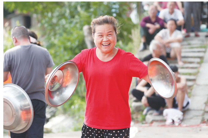
敲锅盖应援赛龙舟。