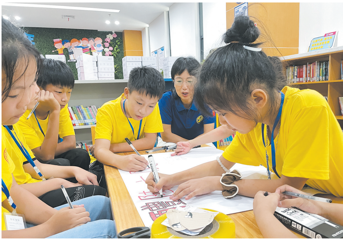
孩子们以画笔代书自己的心声。

另外,夏令营还专为家长设置了“正面管教”家庭教育讲座,在轻松愉悦的氛围中,将新颖的教育理念和有效的鼓励方法传递给家长,学会如何帮助孩子健康成长。