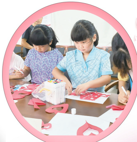
雷打石镇剪纸活动现场。