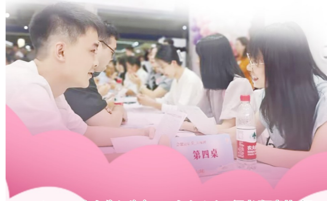
8月22日,我市举行单身职工交友活动。