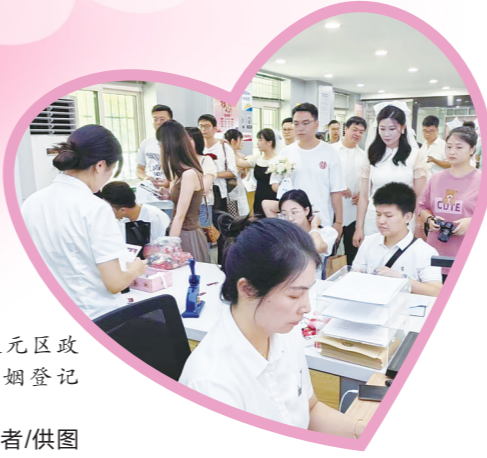
七夕节,天元区政务服务中心婚姻登记大厅甜蜜满满。

据市民政局统计,截至22日下午5时,全市共有203对新人领证。其中,醴陵市民政局婚姻登记处为76对新人办理了婚姻登记业务,天元区民政局婚姻登记处为48对新人办理了婚姻登记业务。