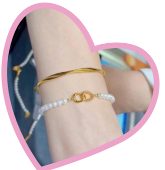
市民试戴黄金饰品

拼多多百亿补贴数据显示,今年七夕,以95后为代表的年轻人成为黄金消费主力,订单占比超过45