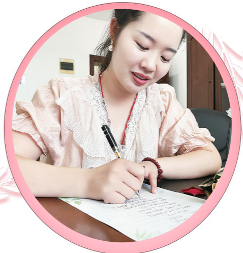
群丰镇开展手写信活动。

截至目前,全市各级工会累计举办线上线下联谊活动3000多场,服务职工近50万人次,促成牵手23000多对。团市委连续10年开展“青春恋爱季”单身青年婚恋交友系列活动和服务,先后举办市级示范性线上、线下婚恋交友活动452场,帮助1000余对青年步入婚姻殿堂。市妇联在全省率先启动“缘来是你”婚姻婚恋指导服务公益项目,开展各类联谊72场,参与人数4083人,意向牵手388人。