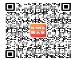
扫二维码7天内(8月28日)有效,重新进入请更新

名侦探派蒙: 不要乱花钱,千万别碰“校园贷”,不要去“刷单”,也不要买上门推销的任何东西,就算是所谓的学长学姐推荐的。对于不熟悉的人,切勿交浅言深,在不了解对方时,不要轻易暴露自身的底细,注意个人信息保密。不要随意点击陌生网站,不要随意扫取陌生的二维码,更不要通过陌生链接下载App。遇到不清楚的事,一定要互问、多打听、多咨询,反复核实。要经常与家里联系,把自己在学校的情况告诉家长;要与家长约定好汇款条件、方式,避免家长草率汇款;在外要始终保持通信畅通,如果被骗请第一时间拨打110报警。