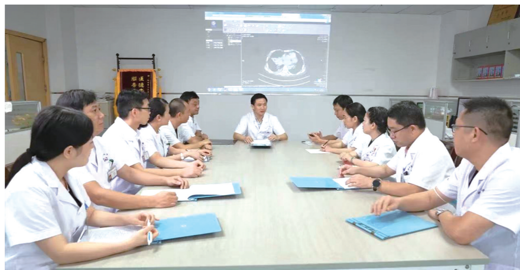
▲肿瘤诊疗中心针对患者病情开展MDT多学科会诊。

2023年8月19日是第六个“中国医师节”,在这特别的一周里,我们走进株洲市二医院,对话“硬核”科室及青年骨干医师,聆听他们与患者之间“性命相托”的动人故事,见证他们心系病患、情系科室的初心使命,辅叙科室跨越式发展的“蝶变”历程。