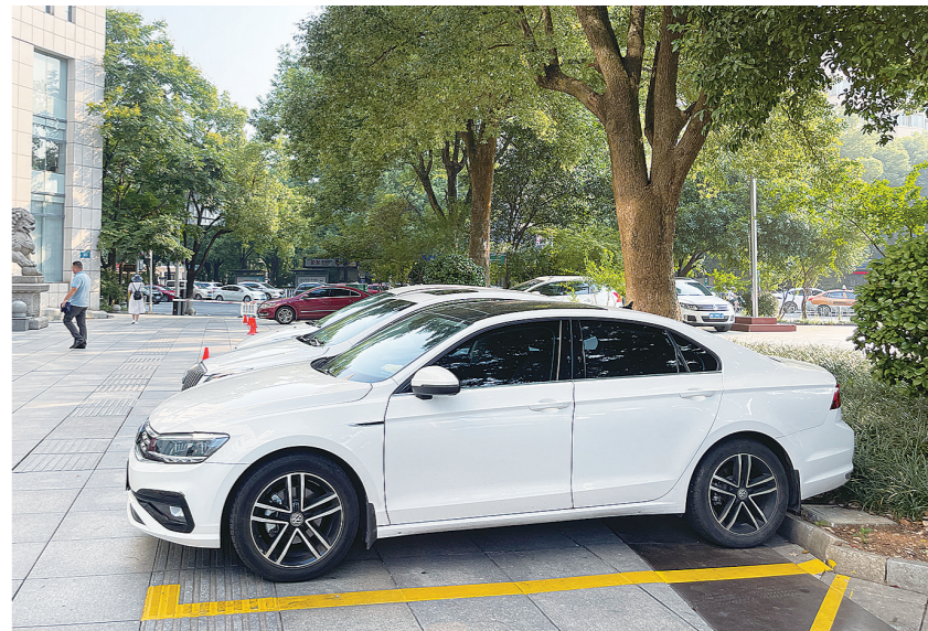
市财政局等30个市直机关单位的停车场已实行错时开放政策,为有需求的市民提供便利。