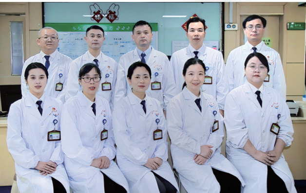
▲心血管内科团队。