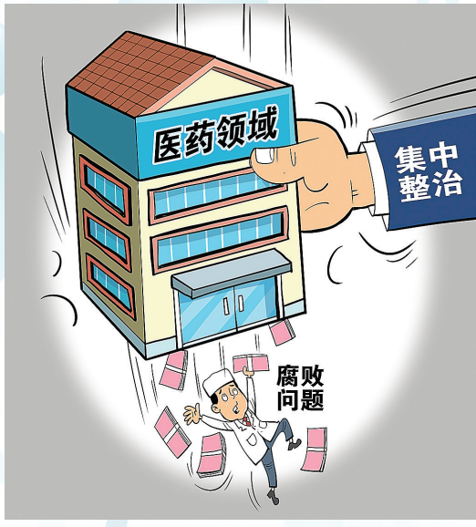
朱慧卿 作

随着医药反腐持续推进,医药企业的高额销售费用受到广泛关注,也成为了高悬在企业头上的“达摩克利斯之剑”。那么,医药企业的销售费用中究竟有什么“猫腻”?最终去了哪?