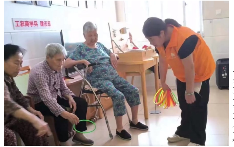
小周(右)和老人们在一起。

小周是一所养老院的护工,主要工作是照顾老人的饮食起居。她学的是老年保健与管理专业,目前她已工作了四个月,小周表示,这里的老人一直盼着子女的陪伴和关怀,她希望将快乐带给他们。