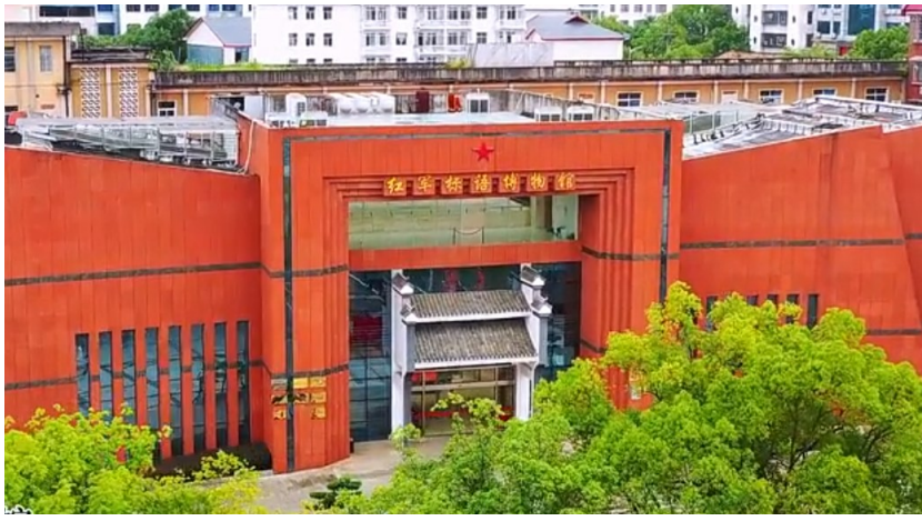
炎陵县红军标语博物馆。