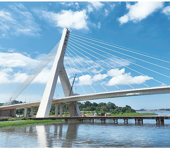
由中国路桥工程有限责任公司(中国路桥)承建的科特迪瓦经济首都阿比让科特迪斜拉桥项目12日竣工通车。科科迪桥项目主线总长约1.63公里，其中主桥为钢槽梁单塔斜拉形式，全长630米、主跨长200米、主塔高108.6米。