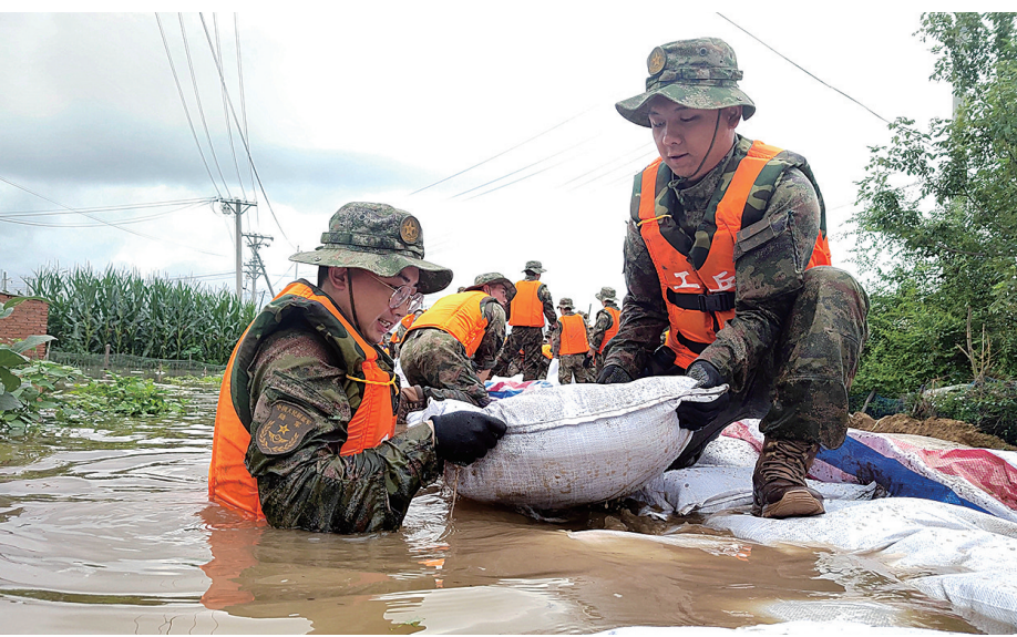
8月9日,在哈尔滨市双城区万隆乡增产村抗洪现场,陆军第21集团军某旅官兵在筑坝。

据新华社北京8月9日电 据中央气象台预报,10日白天起,今年第6号台风“卡努”的外围云系将开始影响我国吉林和黑龙江交界处,主要降雨时段为10日夜间至12日白天,最大累计降雨量可达120至180毫米。 目前“卡努”以每小时15公里左右的速度继续向北偏西方向移动,强度变化不大。预计“卡努”将于10日上午在朝鲜半岛南部沿海登陆,登陆时强度为强热带风暴级(25至30米/秒,10至11级),登陆后强度逐渐减弱。 受“卡努”带来的风雨影响,预计黑龙江大部、吉林东部等地将出现强降雨,局地有大暴雨。 数据显示,7月下旬以来,东北地区多强降雨天气。黑龙江大部、吉林西部、辽宁南部等地降雨量较常年同期偏多3至8成,黑龙江东南部、吉林北部和西部等地部分地区偏多1倍以上,导致多条河流出现超警洪水,吉林舒兰、黑龙江五常、尚志等地遭受暴雨洪涝灾害。