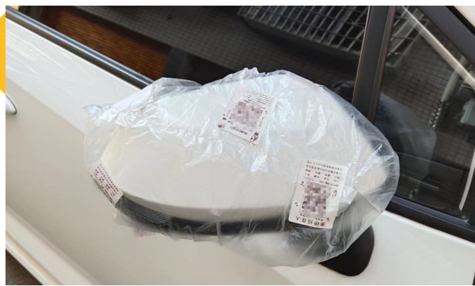
小区居民用塑料袋包好倒车镜。