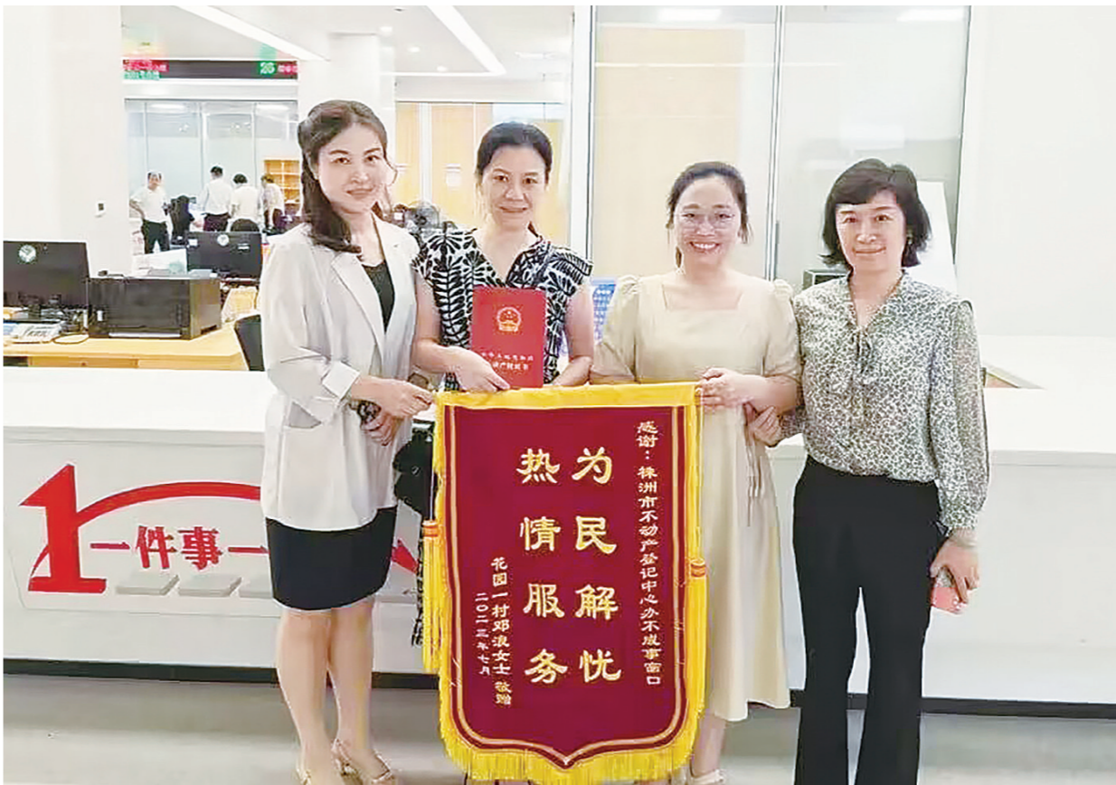
邓女士(左二)为“办不成事”窗口点赞。