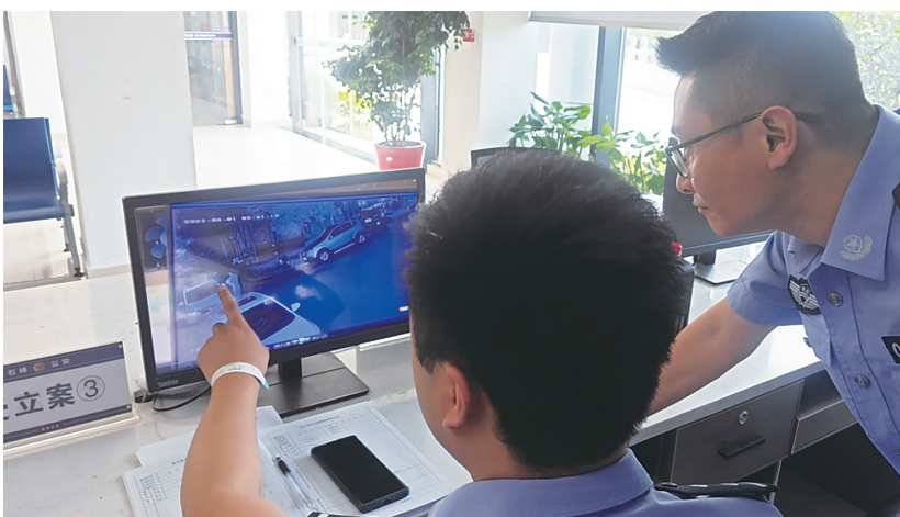
石峰公安通过研判锁定作案嫌疑人。

本报讯(株洲晚报融媒体记者/沈全华 通讯员/王斐妮)近日,石峰公安分局组织警力,成功打掉以发放涉黄小卡片招嫖为名实施电信网络诈骗犯罪的团伙,抓获涉案人员3人,收缴涉案打印