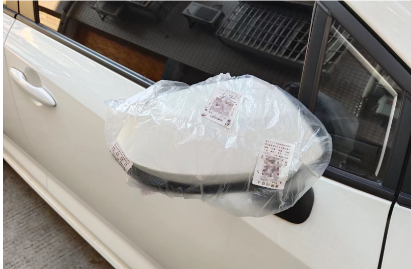
小区居民用塑料袋包好倒车镜。