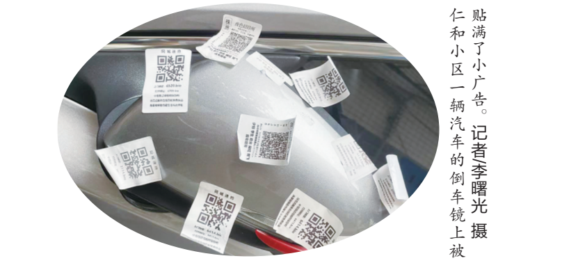
贴满了小广告。仁和小区一辆汽车的倒车镜上被

记者注意到,在居民提供的微信群里,警方多次发布提醒:请广大市民自觉抵制,不要扫小广告上的二维码,谨防掉进骗子的陷阱。据了解,自3月份来,天元区警方先后打掉犯罪团伙8个,破获案件28起,处理违法行为人49人,有效震慑了此类违法犯罪。此外,记者在网