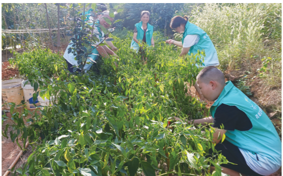
志愿者帮着在菜地采摘辣椒,再帮着售卖。

“两个人年龄大,又都有精神疾病,都不会称秤。”今年,爱心互助会又把售卖的活揽了过来,大家