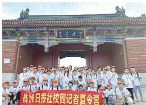
学生们打卡上海交通大学。

目前,株洲日报社南京夏令营“夏令营之金陵探索记”火热招募中,将于8月21日出发,余位已不多。报名咨询电话(22872691、28833827)