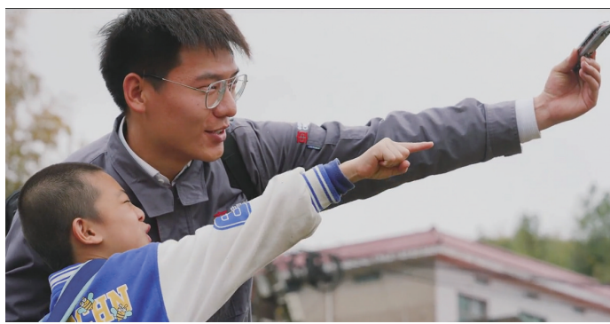
微电影《山那边》截图。

有这样的一个工作岗位,他关系着地铁系统的中枢神经,用匠心“照亮”出行路。他们在一线平凡岗位上,做“坚守初心”的不平凡人,彰显出中车人的优秀品质。