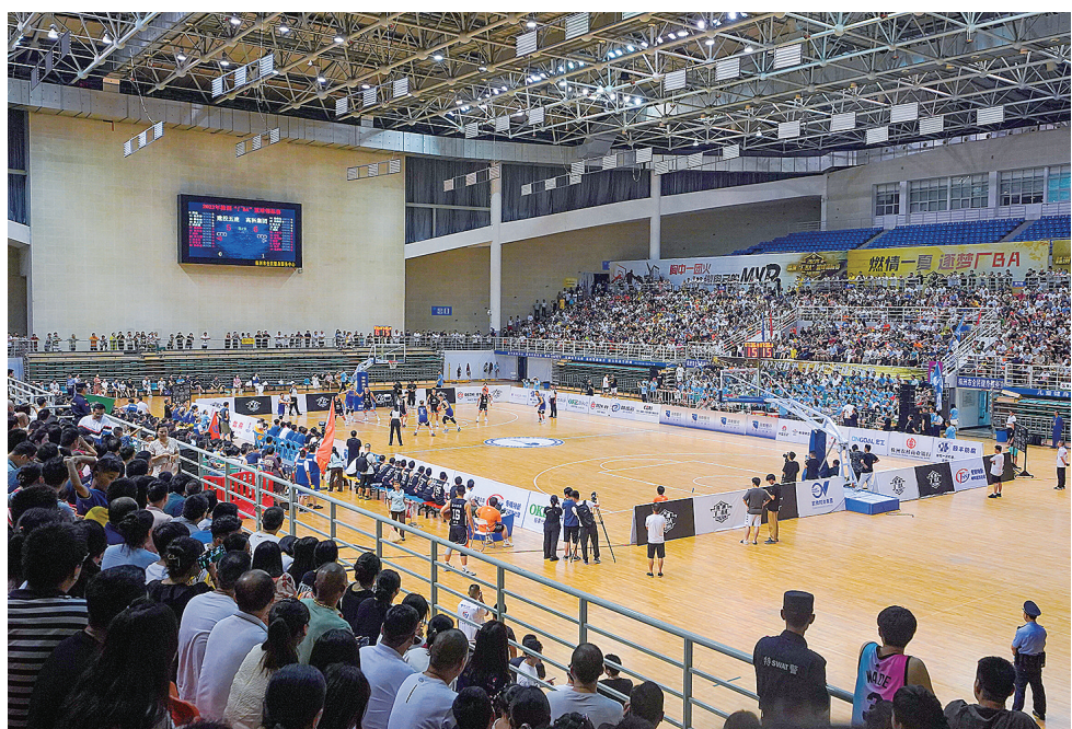
“厂BA”比赛现场。