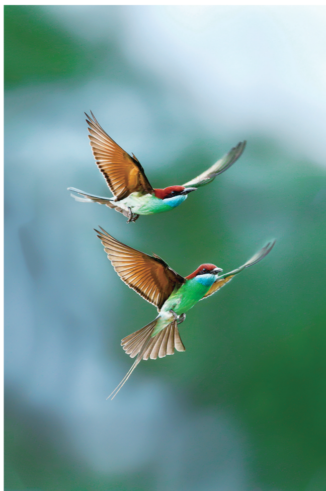
蓝喉蜂虎 (2022.7.2,摄于航空大道附近蒋家冲)