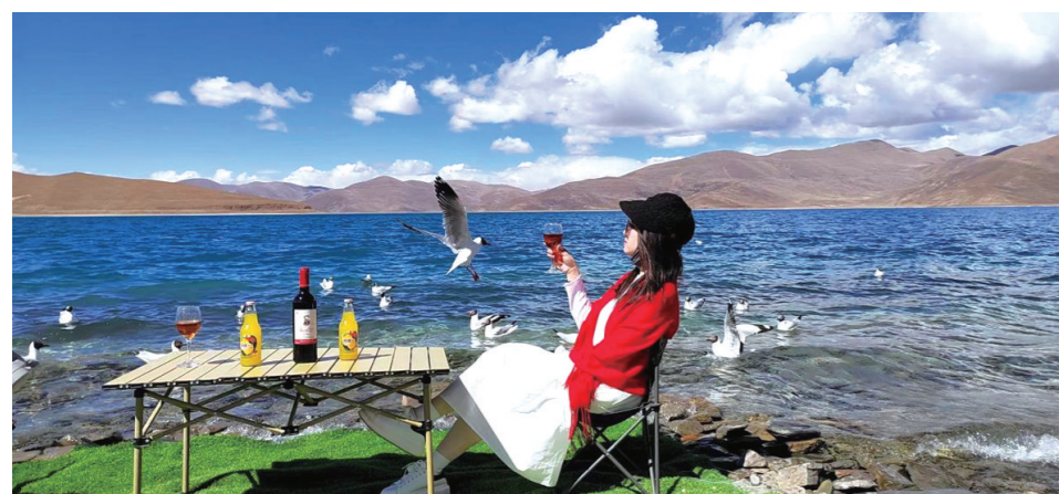
2023,约几个人,我们一起自驾去西藏。

一台车的自驾之旅,总没有一群人来的快乐。而我们则是一支湖南人的自驾车队,氛围极好,队员之间互帮互助。领队对西藏极其熟悉,还有专业摄影师随队,每天给你带来一天的美照,这样的自驾进藏之旅才是湖南人不容错过的自驾之旅。