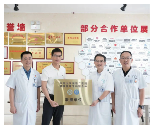
▲“联盟单位”授牌仪式现场。

名医会不定期来市二医院健康管理中心坐诊体检,帮助医院提高诊疗水平,为客户提供优质服务,助推医院高质量发展。 一直以来,市二医院健康管理中心是医院重点打造的以“人民健康为中心”的临床品牌学科,是株洲市内健康管理领域学术影响力机构之一。作为株洲市癌症早期筛查基地,市二医院健康管理中心每年承担市内高危人群肿瘤筛查1万余例,早期肿瘤发现率达12%。中心专家团队在市知名专家冷雪教授的带领下,开展以肿瘤筛查为特色,针对亚健康人群进行健康体检、健康评估、健康干预的相关服务。目前,市二医院健康管理中心参与国家级课题1项,主持省级课题3项,负责市级课题3项,获湖南省医学科技奖三等奖1项,株洲市科学技术进步奖三等奖1项,持有实用新型专利7项。