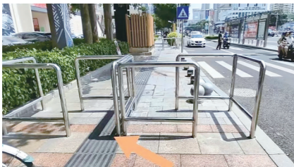
无障碍通道入口Z字形不锈钢设施(资料图)。