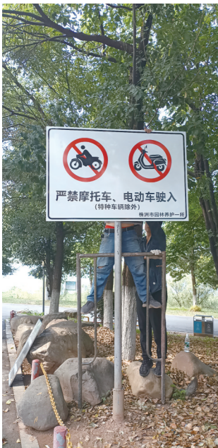
在无障碍通道入口处,工作人员正在加紧安装标示标牌。