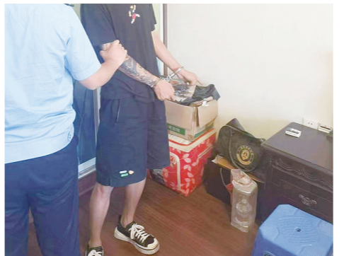
武某指认盗窃现场。记者/沈全华 通讯员/王斐妮 摄

一切都来得太突然,黄女士不敢相信平日亲近的男友怎么会做出这样的事?带着一连串的问号和愤怒,她选择报警求助。