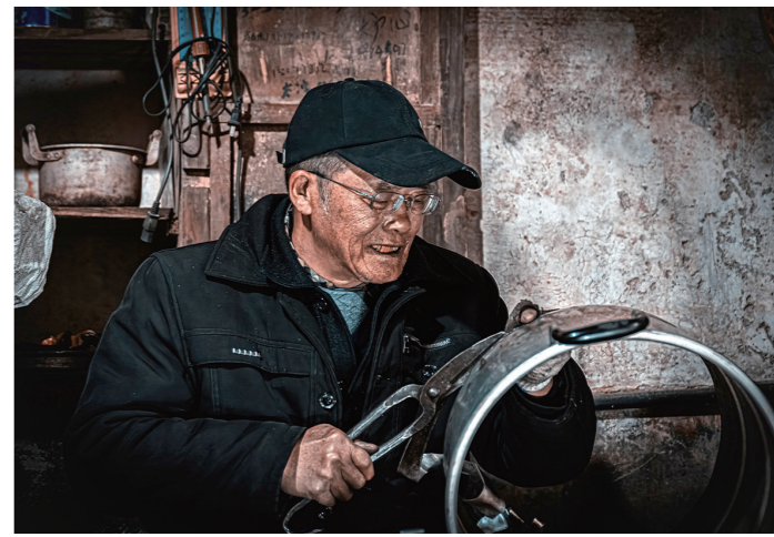
文师傅40年前只身从浏阳来到朱亭,跟当地师傅学铁艺,在朱亭扎下了根。