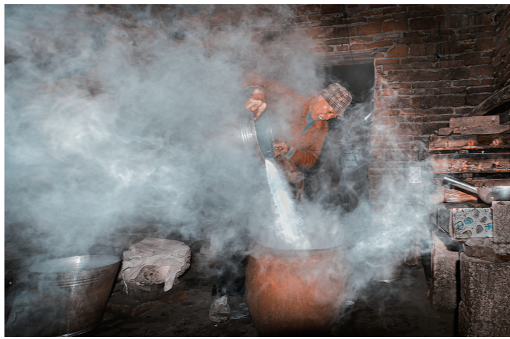
做了20年豆腐的谢师傅,靠着这个小生意撑起了一个家。