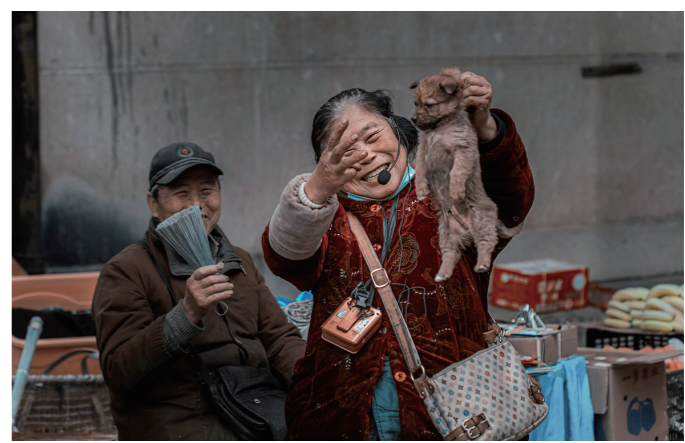
来自桃子乡的贺姨她,为卖狗还特意整了个电子小喇叭帮助吆喝。