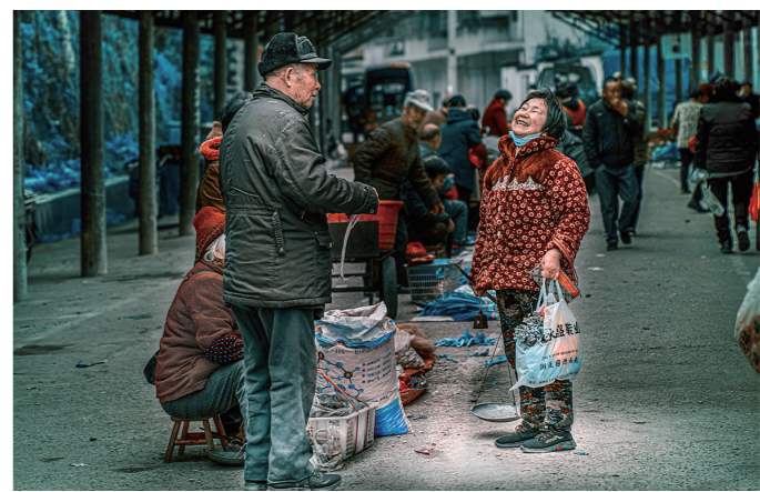
三个老板,一个卖菜、一个卖农资、一个卖日杂,今天的生意都不错。

如今,水运日渐衰落,但京广铁路、京港澳高速、省道依然假道于此。朱亭依然是十里八乡的首府,千年古镇依然焕发着日久弥新的魅力!