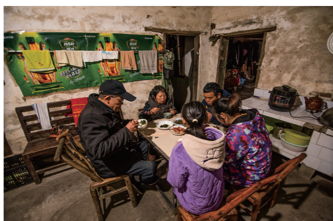
每日的晚餐一家人祖孙三代齐聚,这也是现代社会不多见的幸福生活。