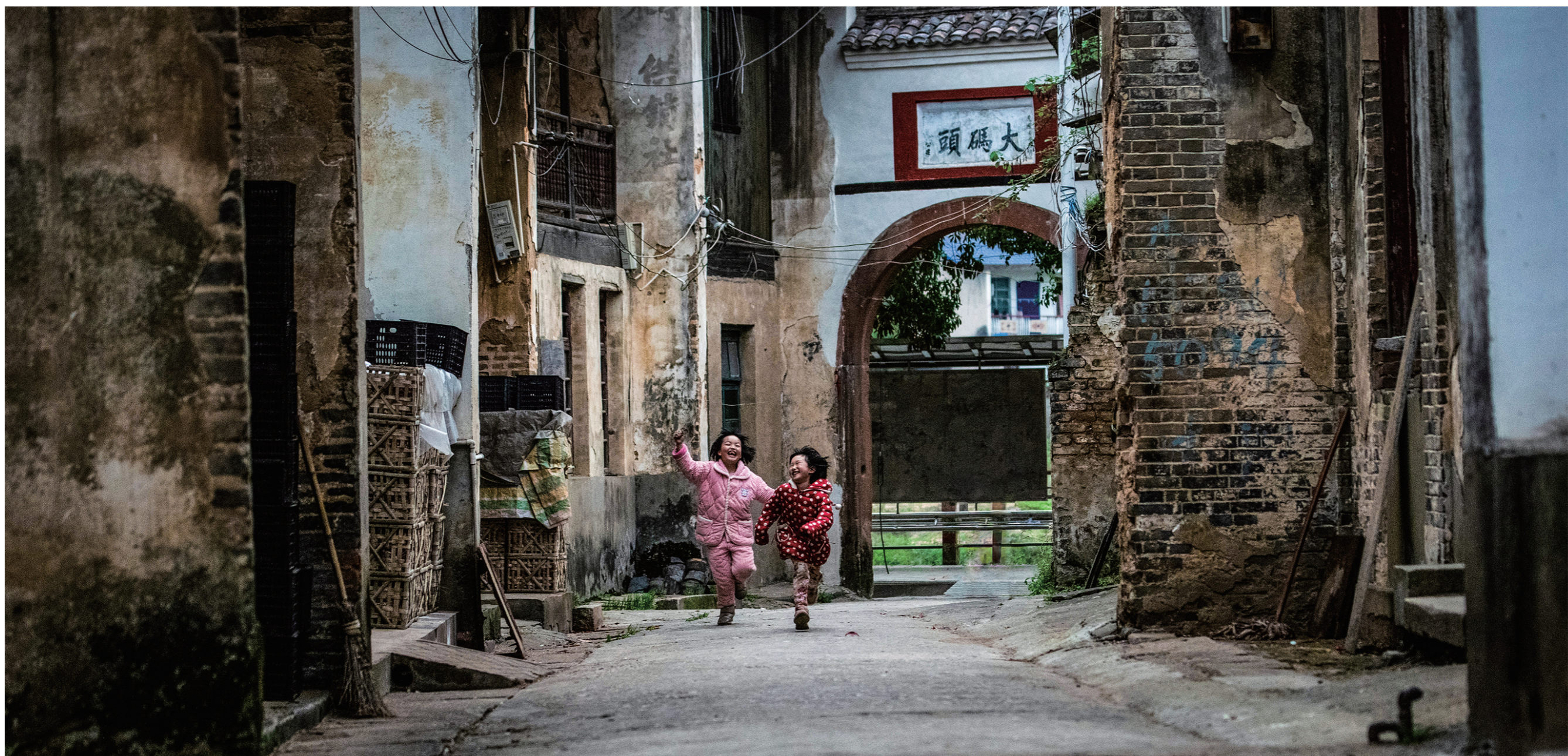
平时的老街安静寂寥,两名欢快的小孩突然而至,天使般的欢笑划破了沉寂。