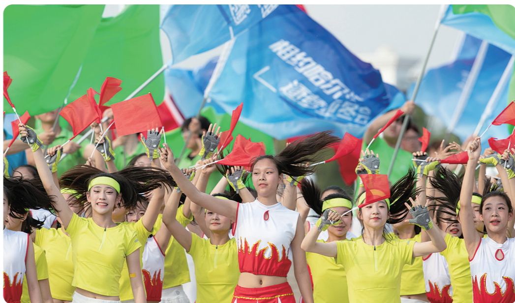
7月8日，演职人员庆祝哈尔滨市获得2025年第九届亚洲冬季运动会举办权。

中国此前举办过两届亚冬会，分别是在1996年的哈尔滨和2007年的长春。这也将是哈尔滨第二次承办亚冬会。