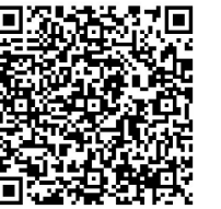
考生可扫码查询指标生录取名单。

根据《株洲市2023年普通高中招生实施方案》(株教函〔2023〕11号)文件精神,指标生录取设定中考学科成绩最低控制分数线。按照城区中考学科成绩30%位次,划定市二中、南方中学指标生录取最低分数控制线为711分;按照城区中考学科成绩45%位次,划定市一中、市四中、市八中、市十三中、九方中学、涪口区五中、市二中枫溪学校、市三中指标生录取最低控制分数线为666.25分。