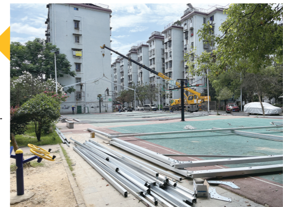
安装在篮球场的棚架被拆除。