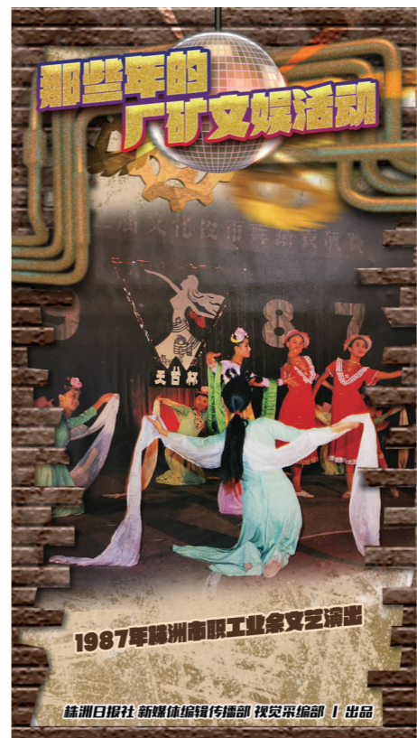
1987年株洲市职工工业文艺汇演