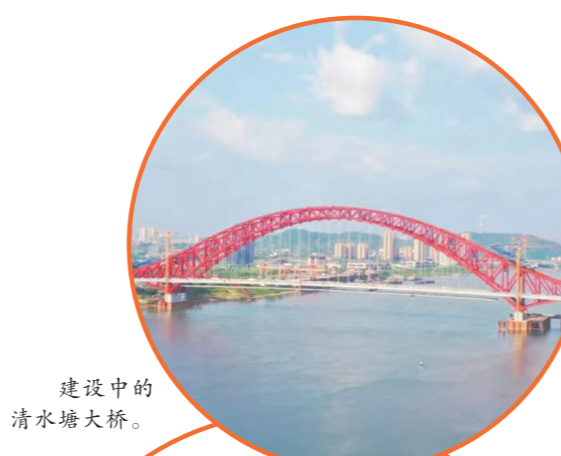
建设中的清水塘大桥。

片区拥有12万平方米临湖看江最佳视野的产业服务中心,目前中车株洲所已入驻。学校、医院今年即将完成签约落地。多家知名地产商已拿地开发。清水塘大桥、公园、1956工业遗址不仅是完善了新城的生活配套,还将成为长株潭网红打卡都市旅游休闲地。