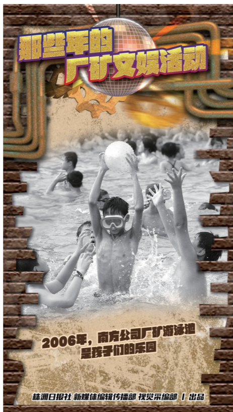
2006年,南岳公司厂矿游泳池是孩子们的乐园