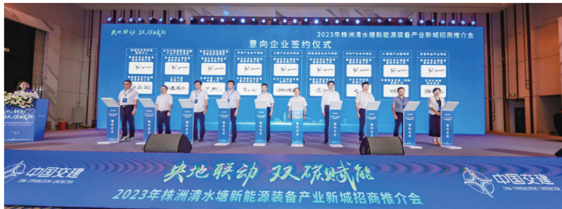
此次招商会共邀请100余家企业到会,其中,新能源、智能制造、产业投资等行业9家企业现场签约。

据统计,该片区内现状居住人口约1.9万人,新增居住人口依据片区新增就业人口3.4万人预测,采用带眷系数计算,新增人口8.5万人。根据产城融合度,综合考虑本地居住用地供给情况,本地居住比例取中值即60%,规划片区居住人口将超10万人。