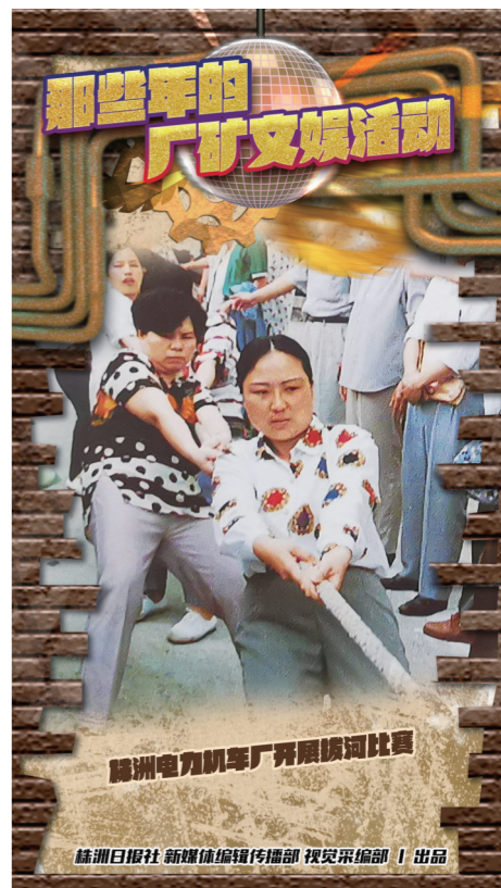
株洲电力机车厂劳模文艺汇演