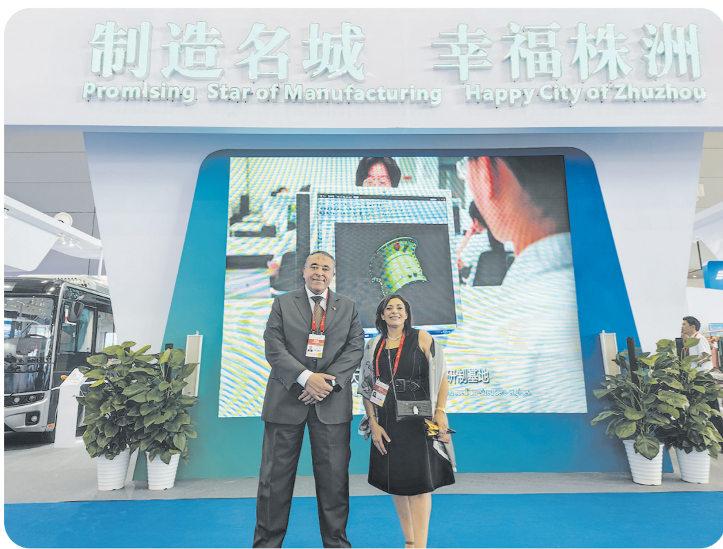
中非经贸博览会上，株洲城市形象馆前，外籍友人打卡拍照。

株洲日报讯(全媒体记者/任远 通讯员/李君) 6月29日上午，第三届中国-非洲经贸博览会暨中非经贸合作论坛在湖南长沙国际会议中心开幕。博览会上，株洲城市形象馆盛大亮相，16家企业组团参展。