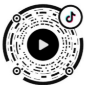
打开抖音扫码观看视频。

响田大桥拓宽改造工程,双向六车道 设计车速60Km/h。响田大桥拓宽改造接线工程位于石峰区响田东路,新建响田大桥位于既有响田大桥北侧,桥梁全长333.5米。6月15日,响田大桥已完成第8跨最后两片50米箱梁架设。