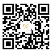
微信扫码观看视频。

昭陵扒龙舟,传承数百年,历史悠久。在昭陵乡音中,“扒”就是“划”的意思。每年端午,村里的年轻人从外地赶回来,和村里的老人们一起把端午闹起来。端午“看水”是昭陵必不可少的项目。今年,昭陵扒龙舟比赛,盛况空前。小编记录昭陵端午请龙、祭龙、放龙、斗龙等习俗,一起把乡愁装进奔流的湘江水里。