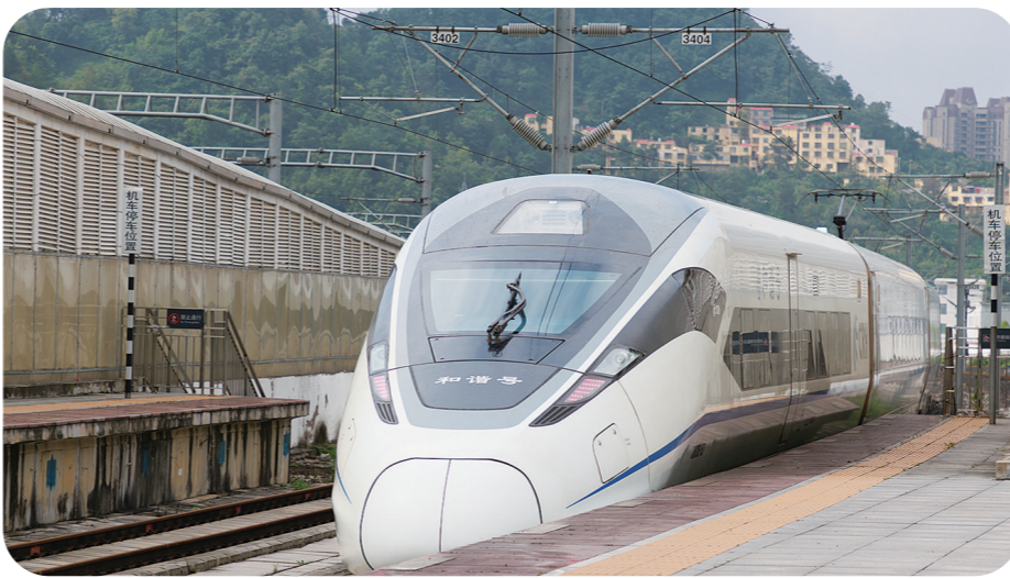
6月26日,55311次试验列车从贵阳北站出发。

汛情通报显示,广东北江干流英德、乌石段及支流连江,广西西江支流贺江、桂江,北流河,江西乐安河、信江支流白塔河、湖南湘江上游干流及支流沱水、潇水,福建闽江上游富屯溪、建溪,浙江钱塘江上游富山港,贵州乌江支流马溪河,云南泸江支流暮春河等45条河流发生超警洪水,最大超警幅度0.01米至2.42米。水利部相关负责人表示,水利部将继续密切关注雨情、水情、汛情,滚动会商研判,指导各地做好暴雨洪水防范工作。