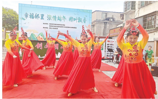
“幸福邻里节、粽飘香小区”活动现场。

本报讯(株洲晚报融媒体记者/杨凌凌 通讯员/胡子凤) 6月19日,为了让辖区居民感受到节日的气氛,增进邻里之间交流和联系,芦淞区龙泉街道在荷叶冲社区淞亿小区开展了“幸福邻里节、粽飘香小区”端午节主题活动。