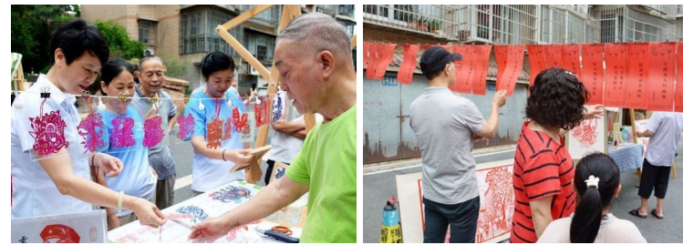
活动让居民感受到传统文化的韵味,也促进了社区邻里的团结与和谐。