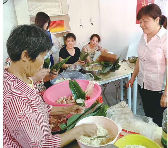
小区居民包粽子,看望老人。

本报讯(株洲晚报融媒体记者/何春林) 折粽叶、填糯米、封口、扎捆……6月19日,石峰区泉塘湾小区党支部活动中心内欢声笑语不断。这里,小区居民正在举行“迎端午、包粽子、送温暖”活动。