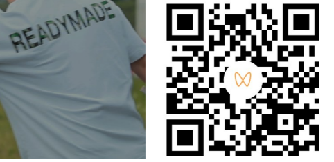
微信扫码观看视频。