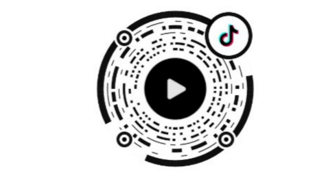
打开抖音扫码观看视频。