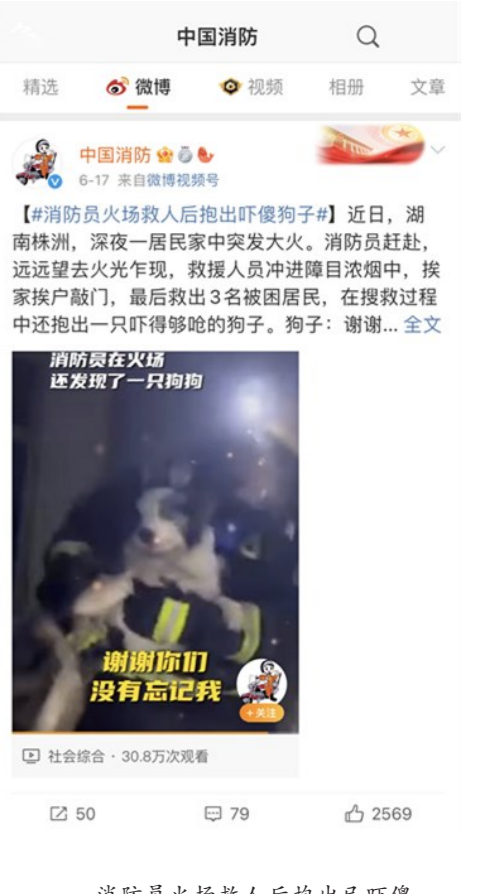
消防员火场救人后抱出已吓傻的狗子。近日,一居民家中突发大火。救援人员冲进浓烟中,救出3名被困居民,在搜救过程中还抱出一只吓得够呛的狗子。狗子:谢谢蓝朋友没有落下我!