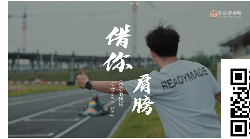
父亲节,一起来看,这对父子的“速度与激情”。