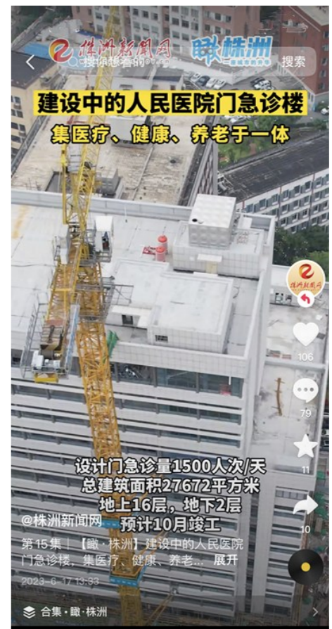
建设中的株洲市人民医院门诊楼,设计门诊量1500人次/天,总建筑面积27672平方米,地上16层,地下2层,预计10月竣工。