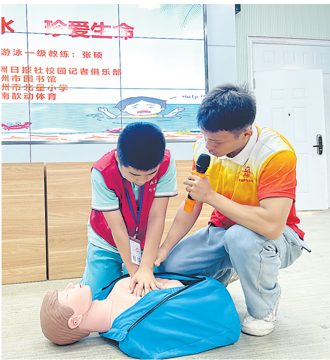
教练与校园记者互动,帮助大家掌握防溺水知识。

本报讯(株洲晚报融媒体中心记者/魏朋 通讯员/刘丽明) 为防止溺水事故的发生,让学生了解和掌握防溺水相关知识和技能,提高学生的安全意识和自救能力,6月7日上午,北星小学在多媒体教室开展了一场“珍爱生命 预防溺水”防溺水安全知识应急演练活动,该校全体校园记者参加了此次活动。