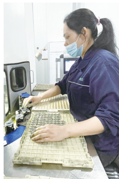
欧科亿生产车间,工人忙着赶订单。

近日,超耐多晶莫来石有限公司生产车间,机器轰鸣,工人们正在试生产。而三年前,这里还是几间破旧厂房,荒草比人高。近年来,炎陵县冠龙金刚石生产有限公司因经营不善,资金链断裂,难以为继,导致土地、设备闲置,成为“僵尸企业”。几年前,从浙江引来的超耐多晶莫来石有限公司,投资2亿元,计划首期建成年产300吨多晶莫来石纤维产品生产线。“僵尸企业”是转型路上的一大障碍。该县以壮士断腕的勇气,实施关停