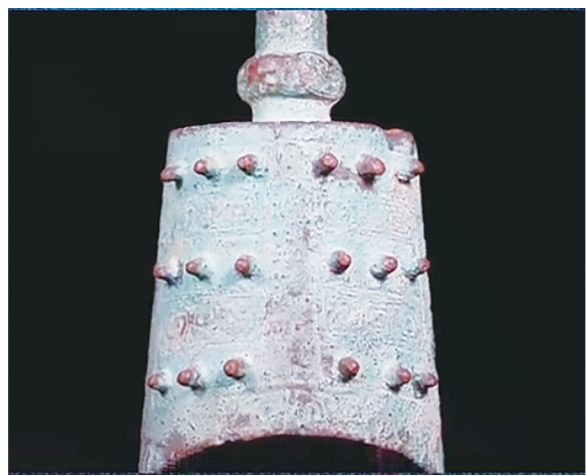
在攸县出土的铜钟。