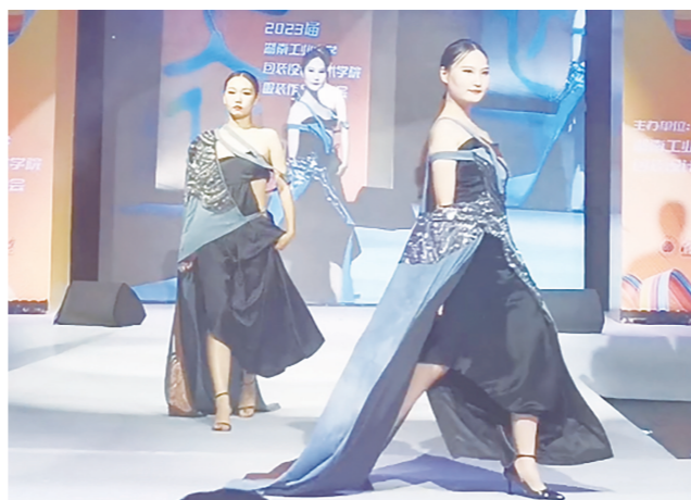
毕业生服装作品发布会现场。