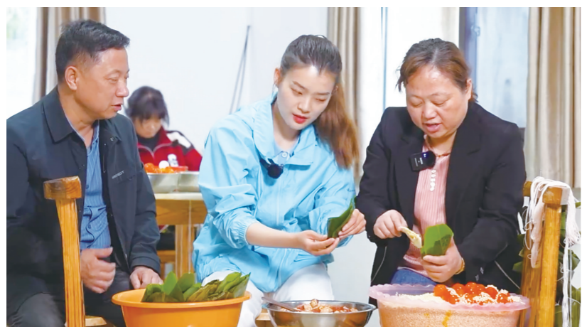
用新鲜的食材,包一个好吃的粽子。