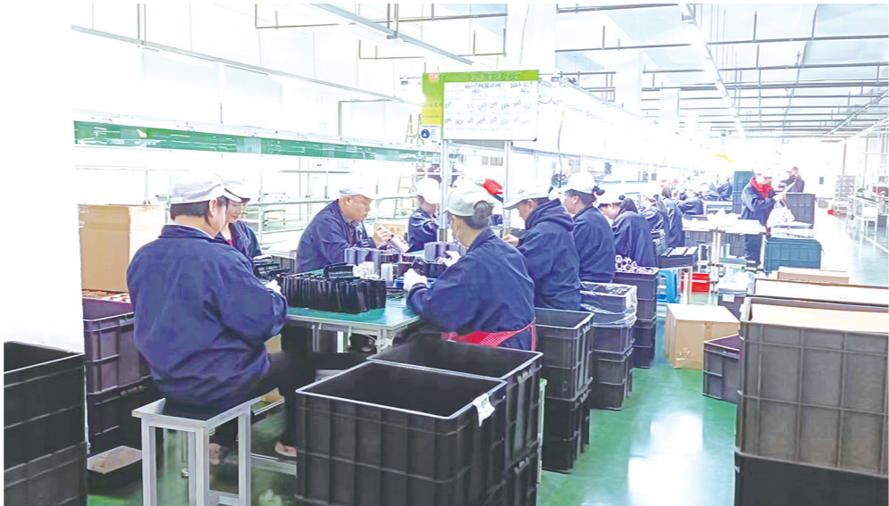
全康电子忙碌的生产车间。

炎陵县科技和工业信息化局负责人介绍,目前,该县已有36家工业企业成为高新技术企业,占规模以上工业企业的35%;去年,该县高新技术产业增加值达25.6亿元,占规模以上工业增加值比重73.1%。