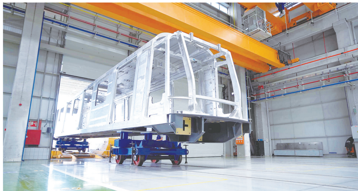
伊斯坦布尔机场线地铁本地化制造项目首列铝合金车体。