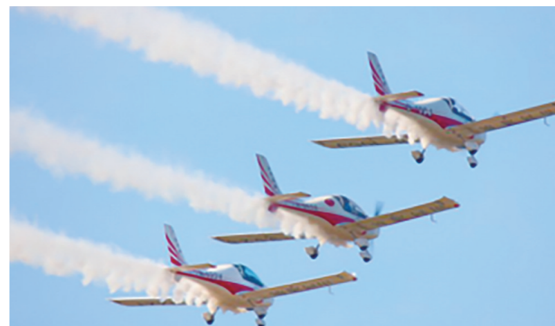
山河航空飞行队进行表演飞行。(资料图)

6月9日,高考结束后,在株洲市中等多个考点上空,山河航空飞行队进行飞行表演,为考生送上祝福。