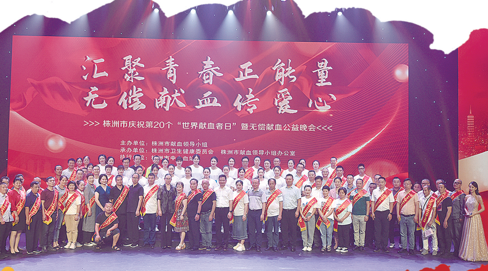
株洲市庆祝第20个“世界献血者日”暨无偿献血公益晚会