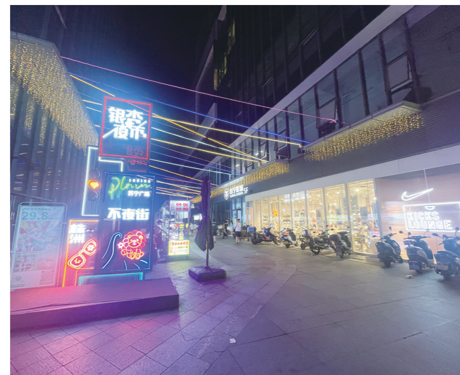
苏宁广场外的银杏夜市，从开业时的火爆到如今有些沉寂

便民服务包括擦鞋、缝补衣物、配钥匙等等，这些小商贩以往游走于城市街头谋生。接下来，城管部门将统一规划，为这些街头便民服务提供规范场所，补齐便民服务短板，让城市有烟火气，更有人情味。