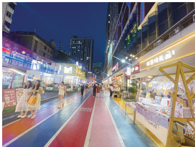
JOJO街上的“玩耶市集”，手工艺品、潮流盲盒摊点成流量关键