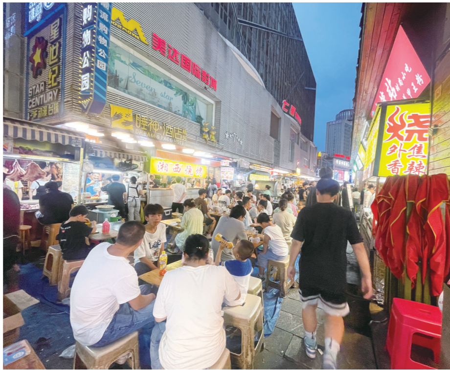
夜间的钟鼓岭，全城最为繁华的美食街

其中，韶兴天街夜市选址株洲火车站对面的广场空坪，考虑结合芦淞服饰城特色，设置小吃摊和服装服饰区，满足周边居民夜间消费购物需求；航空夜市选址芦淞区航空大道附近，希望以此填补周边工