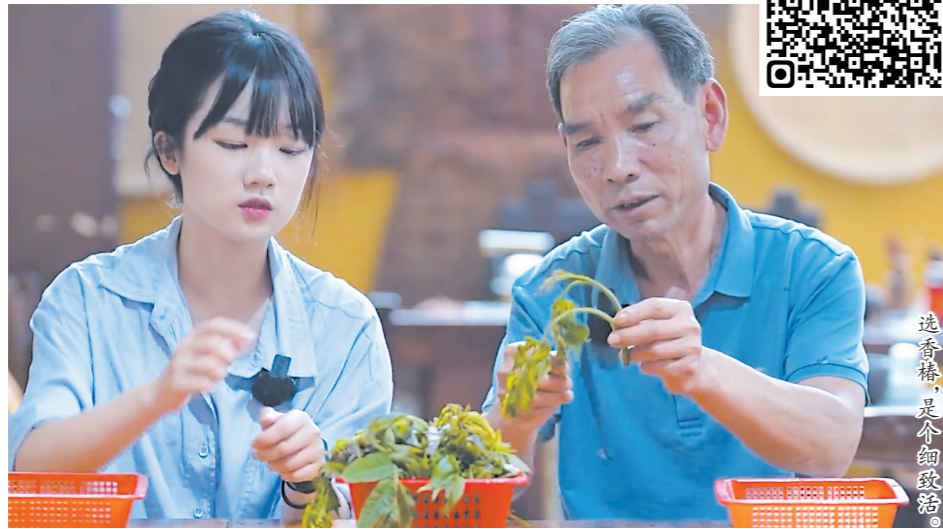
选椿椿,是余韵悠长。