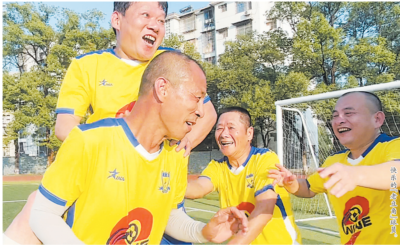
快乐的老豆角足球队。

在株洲,有一群人怀揣着足球梦想,他们通过踢球来强身健体,享受运动的乐趣。他们还发挥余热,在中小学义务普及足球知识,辅导学生练习足球。他们都来自于同一支球队——株洲市“老豆角”业余足球队。