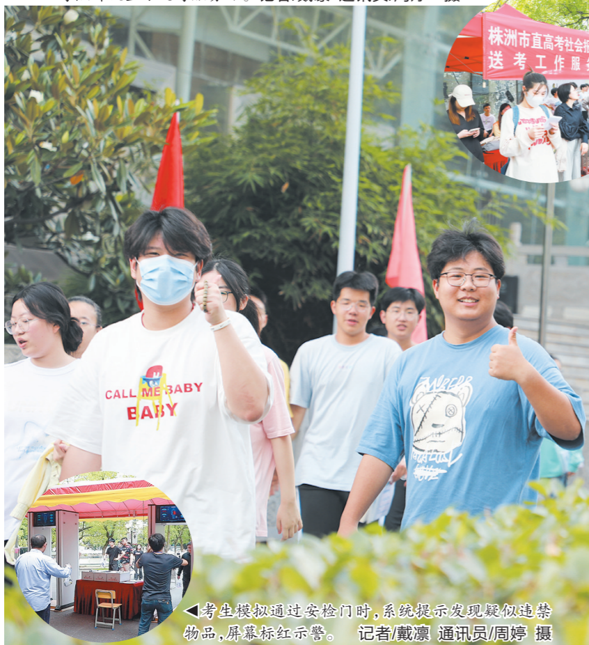
▲考生模拟通过安检门时,系统提示发现疑似违禁物品,屏幕标红报警。