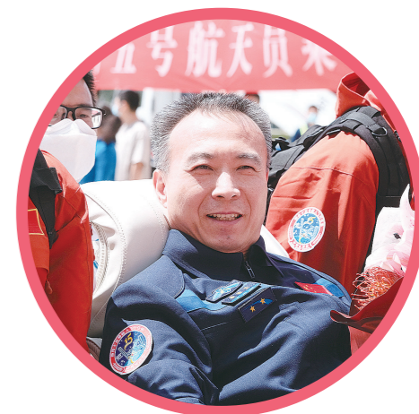
平安抵京,航天员费俊龙脸上洋溢着回家的喜悦。