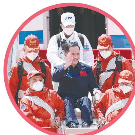
平安抵京,航天员张陆向欢迎人群挥手致意。