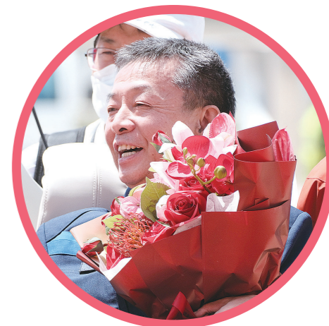
平安抵京,航天员邓清明手捧妻子为其送上的鲜花。