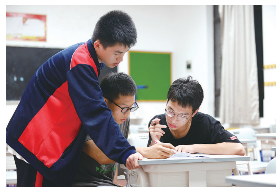
几名男生在教室里探讨试题。