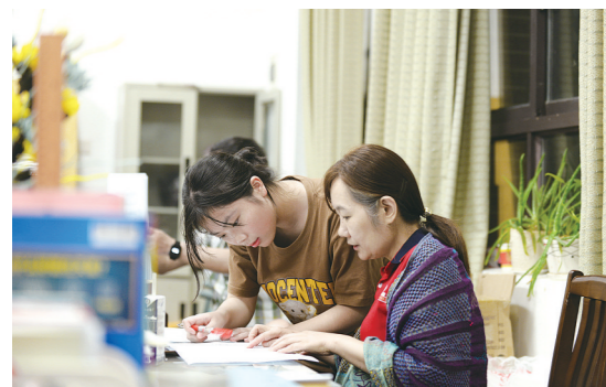
老师留守办公室为同学们答疑。