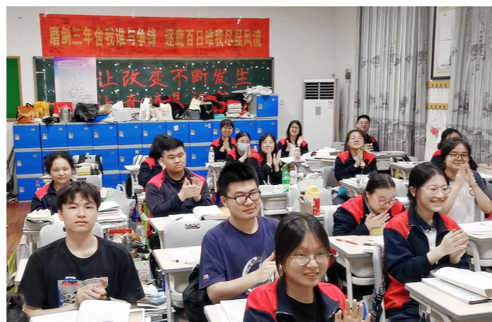
同学们为老师的辛勤付出鼓掌。