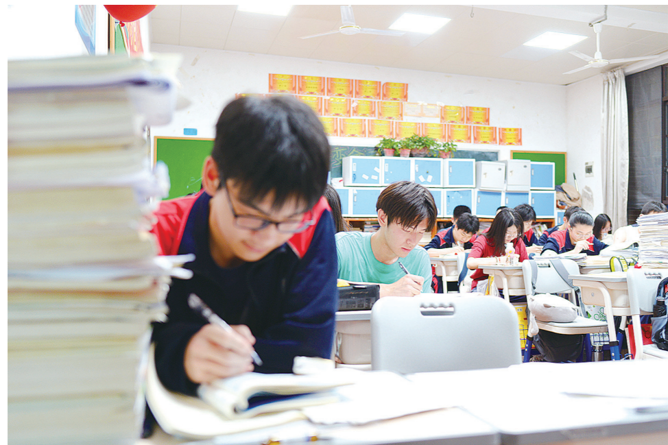
高高的学习材料边,同学们安静复习。