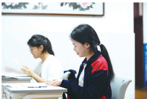
两名女生把课桌搬到走廊间学习。