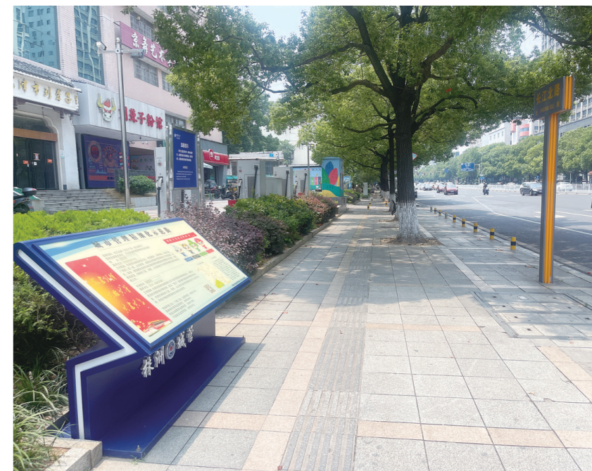
长江北路城管精细化示范街