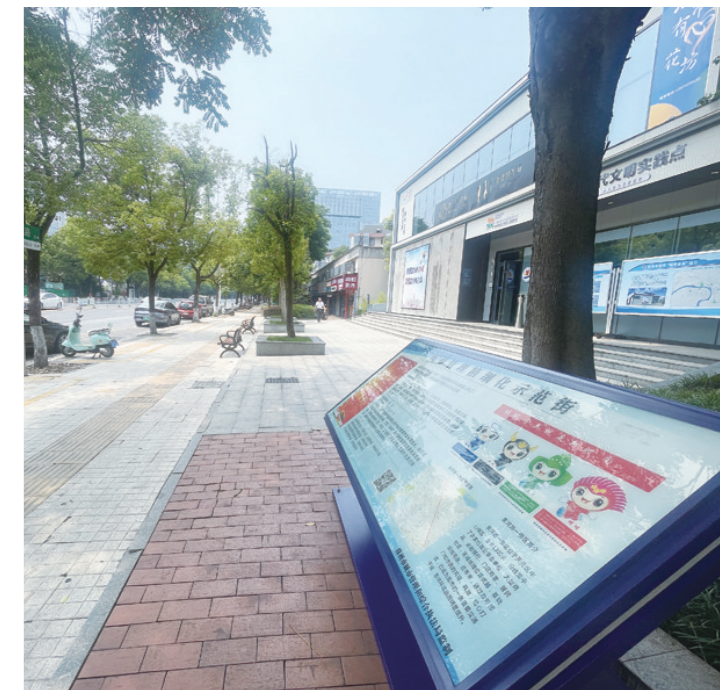
天元区黄河路一街区(市财政局到韶山路口)创建城管精细化示范街,沿街市容秩序大提升