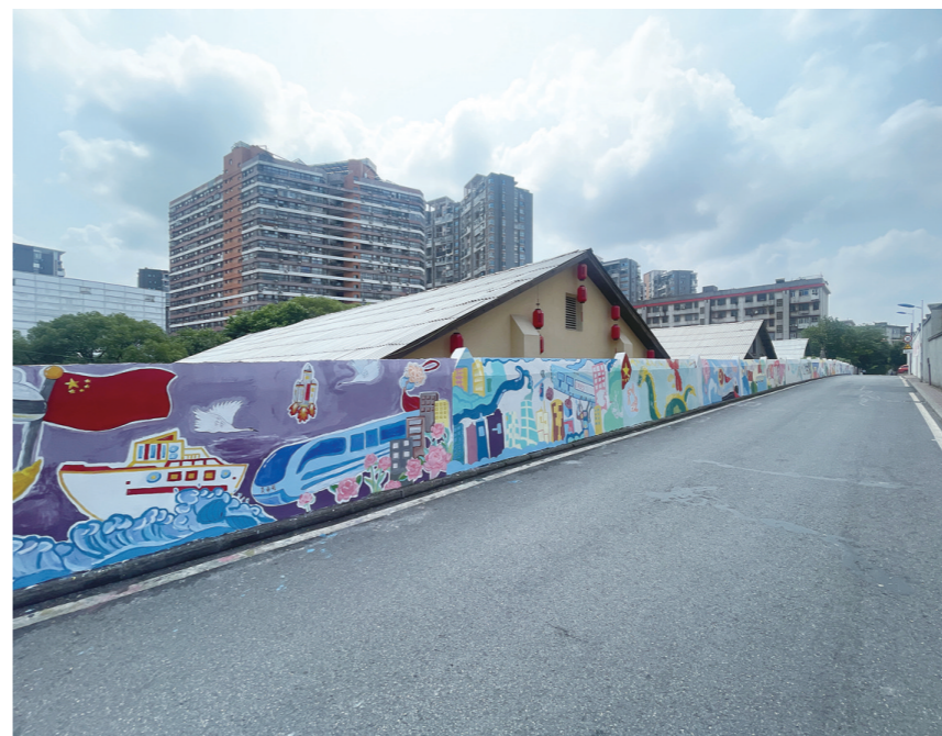
荷塘区育才路,背街小巷要变城管精细化“示范巷”

城市管理向精细化、常态化治理转型,管理者迎来新的考验。精细化的切入点在哪?持续的动力在哪?株洲正尝试给出“最优解”:从2021年启动城市管理精细化示范街创建,通过一条条道路稳步推进的方式,对各个街道的环境卫生、门店经营管理、市政绿化等多个方面逐项优化,目前全市已有19条道路完成示范街创建,美好转变有目共睹,值得关注。