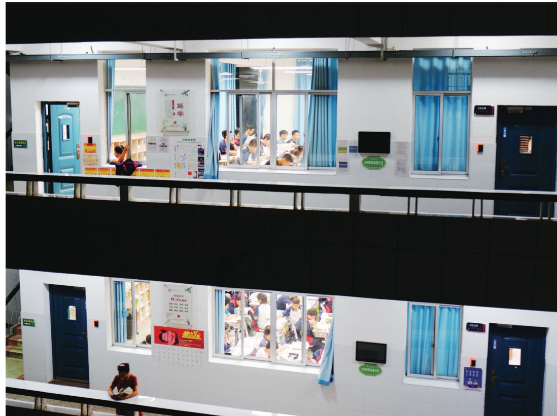
夜幕下,同学们加紧奋战。