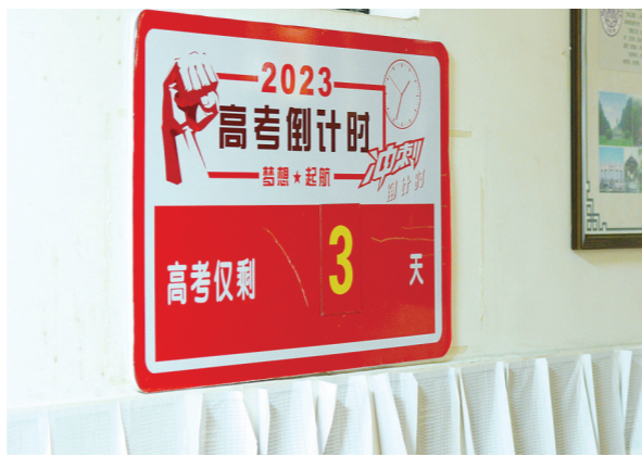
走廊上的高考倒计时牌格外醒目。