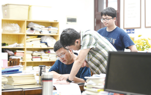
两位老师也在探讨解题思路。

十年寒窗苦读,一朝金榜题名。考生们此刻已是摩拳擦掌、跃跃欲试,只待拔剑出鞘的一刻,他们努力坚持的身影,是青春最美的样子。