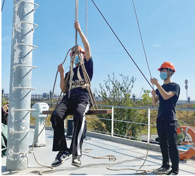
株洲海事职校进行海员技能训练。受访单位供图

本报讯(株洲晚报融媒体中心记者/戴凇)日前,湖南汽车工程职业学院“航海产业学院”签约和揭牌仪式举行,将通过校企联合办学,共建具有行业特色鲜明、与产业联系紧密的产业学院,更好地打造航海专业品牌。并有望将株洲的产业触角,伸向更广阔的大海。