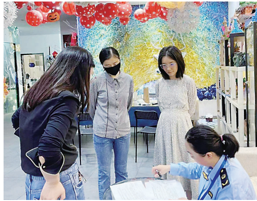
执法人员检查培训机构。

本报讯(株洲晚报融媒体中心记者/戴凇 通讯员/喻阳)日前,荷塘区教育局会同区市场监督管理