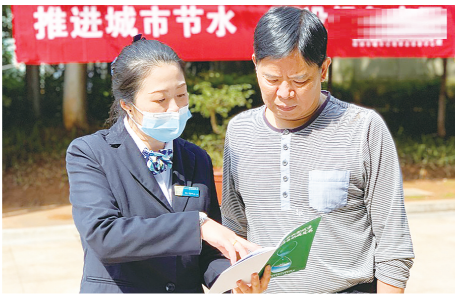
节水宣传周期间,各小区向业主发放节水手册。

在此基础上,又出台《株洲市各县市区“十四五”用水总量和强度双控目标》,一系列节水规划、节水办法,为城市节水工作提供了指南。