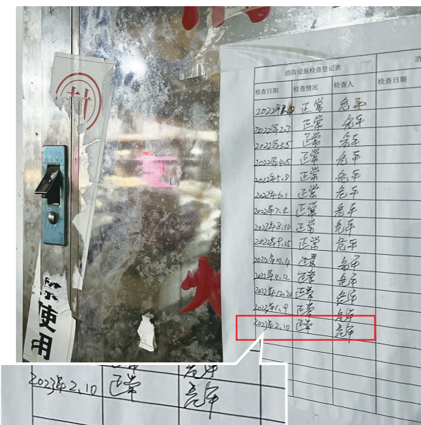
耀莹农贸市场的一处消防栓,最新消防巡查记录为2023年2月。

市场右侧的通道通往自产自销区及居民小区,两旁有违停车辆,还有摆摊现象。有市民建议,在先锋路先锋农贸市场路段的路边及人行道上施划一些机动车位和非机动车位,为有需要的人提供停车便利,规范车辆停放。