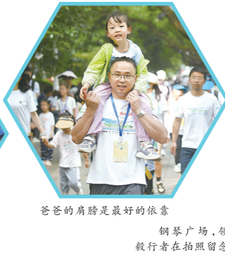
爸爸的肩膀是最好的依靠 钢琴广场，领到证书的毅行者在拍照留念