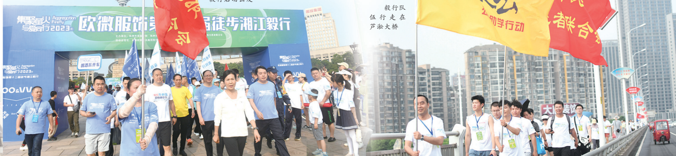
毅行队伍行走在芦淞大桥