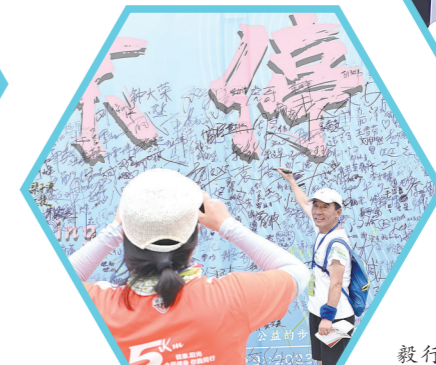
钢琴广场，走完全程的毅行者在签名墙上签名