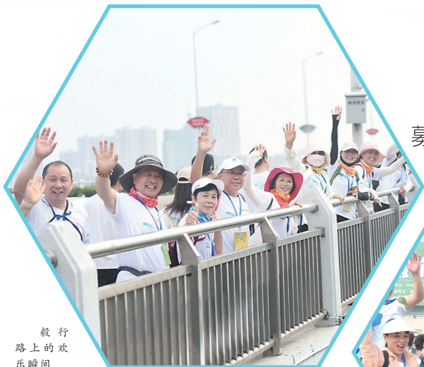
毅行路上的欢乐瞬间

下午3时，随着最后一位毅行者抵达终点，欧微服饰2023第十三届徒步湘江毅行圆满收官。两个组别的毅行者，分别抵达自己期望的终点，在坚持行走的征程中实现了战胜自我。