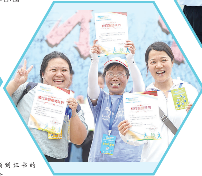
拍照打卡的小伙伴们