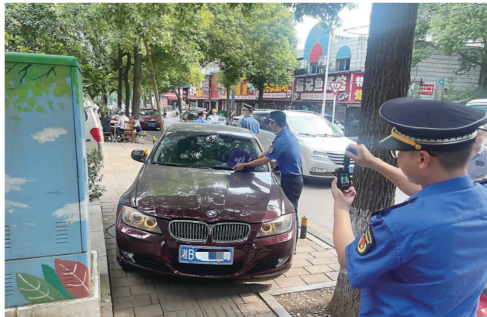
天元区圆方路上,城管部门开展人行道违停专项整治执法。