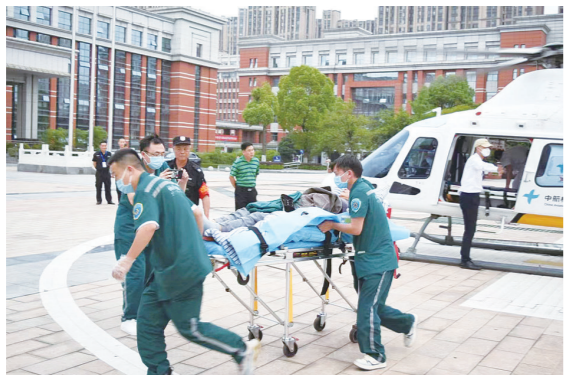
直升机降落在市中心医院,医护人员紧急接走病人。