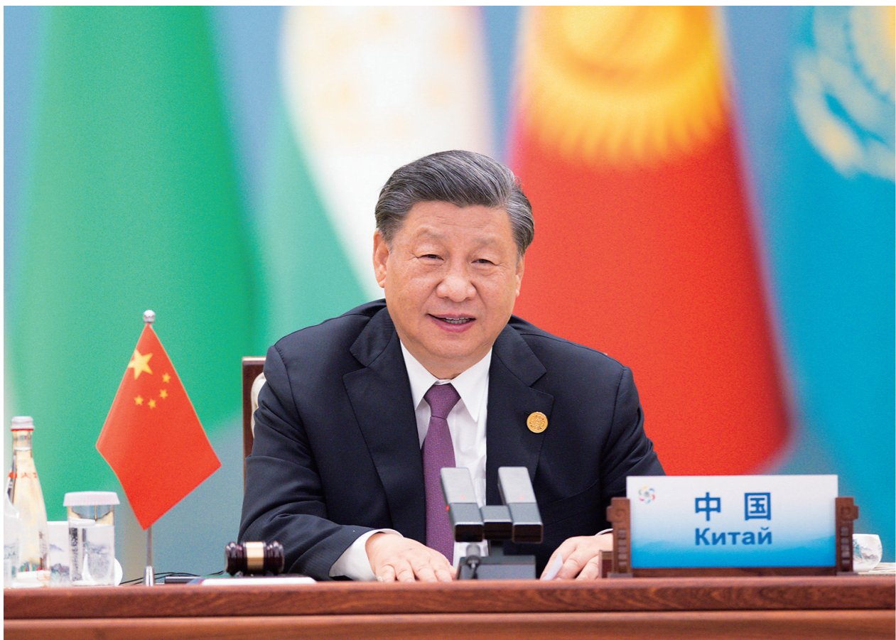
5月19日上午,国家主席习近平在陕西省西安市主持首届中国—中亚峰会并发表题为《携手建设守望相助、共同发展、普遍安全、世代友好的中国—中亚命运共同体》的主旨讲话。