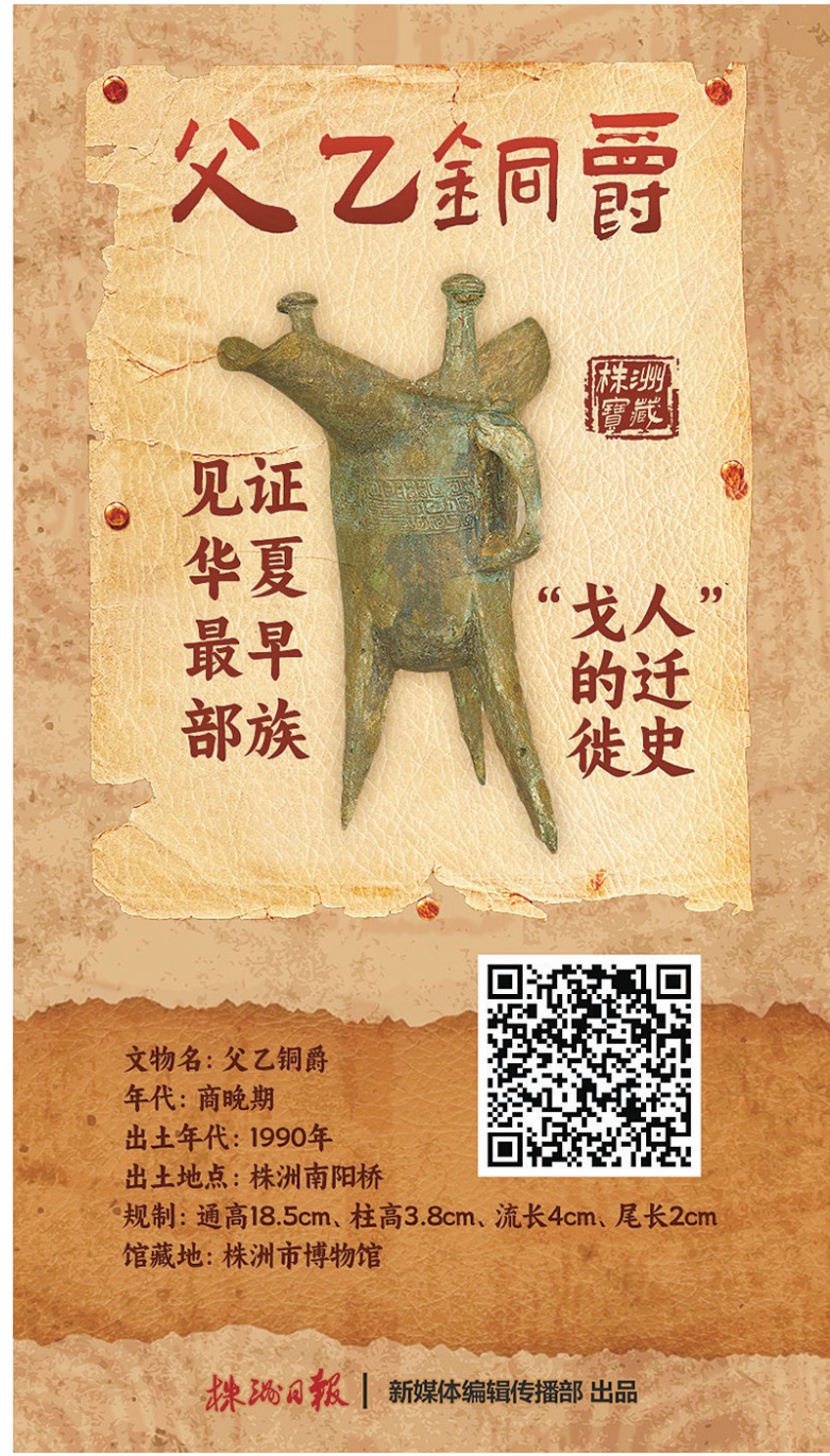
文物名:父乙铜爵 年代:商晚期 出土年代:1990年 出土地点:株洲南阳桥 规制:通高18.5cm、柱高3.8cm、流长4cm、尾长2cm 馆藏地:株洲市博物馆

湘东株洲 吴头楚尾历史悠人文昌盛 世代栖居于此的先民留下了数之不尽的历史文化遗产 成立于1984年的株洲博物馆系国家首批二级博物馆,馆藏5万余件各类文物品类涉及古生物化石、青铜器、陶器、瓷器、金银器、玉器、漆木器、纸质文物等13类以文物的形式全景展现这片土地上悠久而璀璨的人类文明之光 第46个国际博物馆日到来之际让我们一览株洲馆藏文物