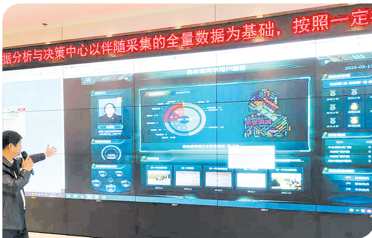
湖汽职院智慧校园系统，让人大开眼界。记者/戴源 摄

据了解，作为株洲市首家“红十字特色高校”，株洲师专科将红十字急救救护培训纳入必修课程，既能拓展学生的急救救护知识与技能，也为学生以后走向教师岗位增添一道安全防线。学校将持续在师资培训、物资保障等方面予以支持，全力保障“红十字特色高校”各项工作的有序推进。