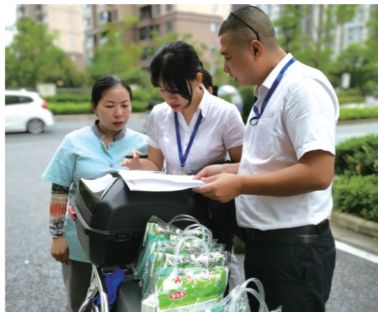
▲晋合物业员工在防疫第一线。

本报讯(株洲晚报融媒体记者/王晖) 今年年初,在市物业管理协会的年会上,来自湖南晋合物业管理有限公司的代表,为与会嘉宾做了一堂分享课程。通过精美的PPT课件,传递了晋合的管理经验,赢得了包括省物业管理协会书记、常务工作会主任封浩建等省市领导、现场同行的高度赞扬。封浩建表示,要拷贝她的课件,在全省物业行业做全面推广。一家来自苏州的物业公司,是怎样在株洲做到99.09%的收费率和97.98%的满意度?一个春天的早晨,记者来到位于天元区湘水湾小区的晋合物业公司,听总经理周坤娓娓道来公司的成功管理经验。