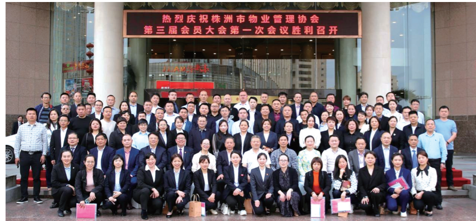
▲出席大会的全体人员合影。

本报讯(株洲晚报融媒体记者/王晖 通讯员/张志刚 雷蕾) 2023年4月12日,市物业管理协会(以下简称“市物协”)第三届会员大会第一次会议在华中大酒店召开。市住房和城乡建设局、市民政局有关领导以及各会员单位负责人与会。