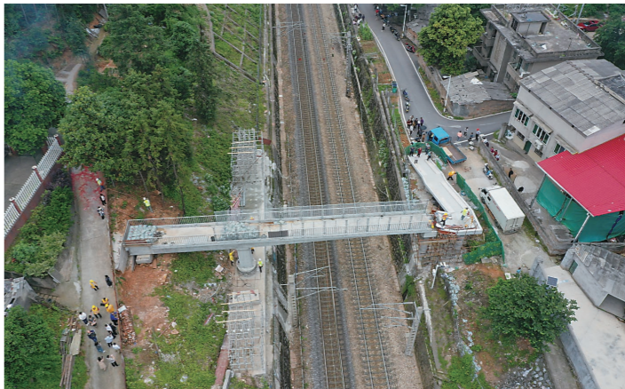
上跨京广线的人行天桥完成转体架设。

“隔着一条铁路,没车过的时候,两边的人大声说话都能听得见,但要碰面的话,差不多要绕行20多分钟。”蒋阿姨说,“有些人不想绕,就直接横穿,后来装了防护栅栏也没用,太危险了。”