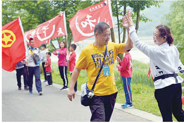
志愿者(右)和毅行人员击掌加油(资料图片)。

5月21日,欧服服饰第十三届徒步湘江毅行活动即将举行。徒步行走22公里,是一种挑战,沿途风景如画,也是一种行走的快乐。