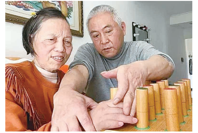
周爷爷在为妻子做康复。

妻子几年前突然瘫痪卧床,年近七旬的丈夫周爷爷每天把她当孩子照顾,自制了十余件康复器具,帮她按摩、做肢体和语言训练等,成功帮助妻子重新走路。