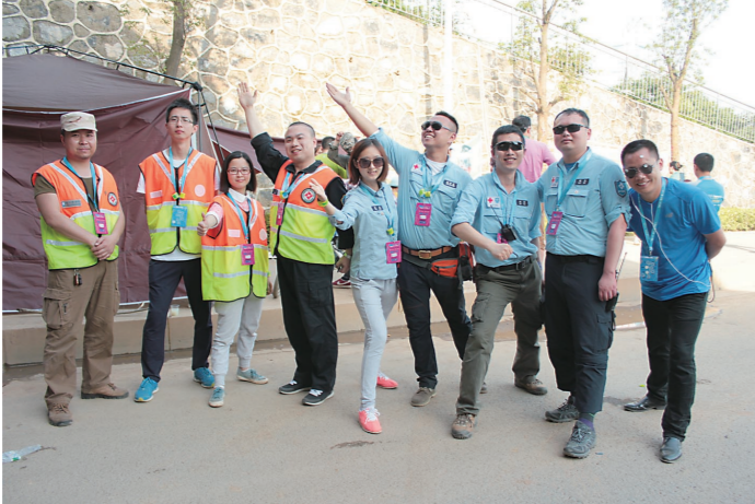
志愿者在现场为毅行者服务。

本报讯(株洲晚报融媒体中心记者/杨凌凌) 他们或许不是毅行路上的主角,但没有他们,就不会有一场完美的毅行活动。他们各司其职,为毅行者提供补给、签到、急救服务……他们是兢兢业业的志愿者。欧微服饰2023第十三届徒步湘江毅行即将开始,时隔三年,志愿者们重新出发,参与这次徒步湘江毅行,奉献自己的力量。