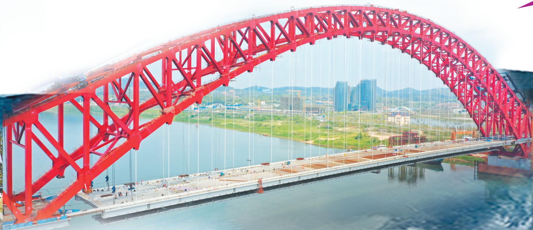
清水塘大桥即将竣工。