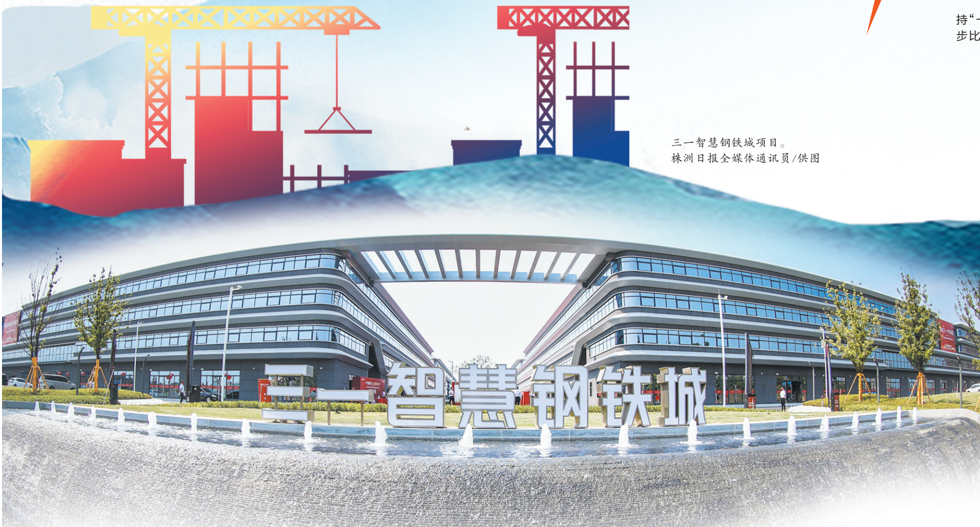
三一智慧钢铁城项目。