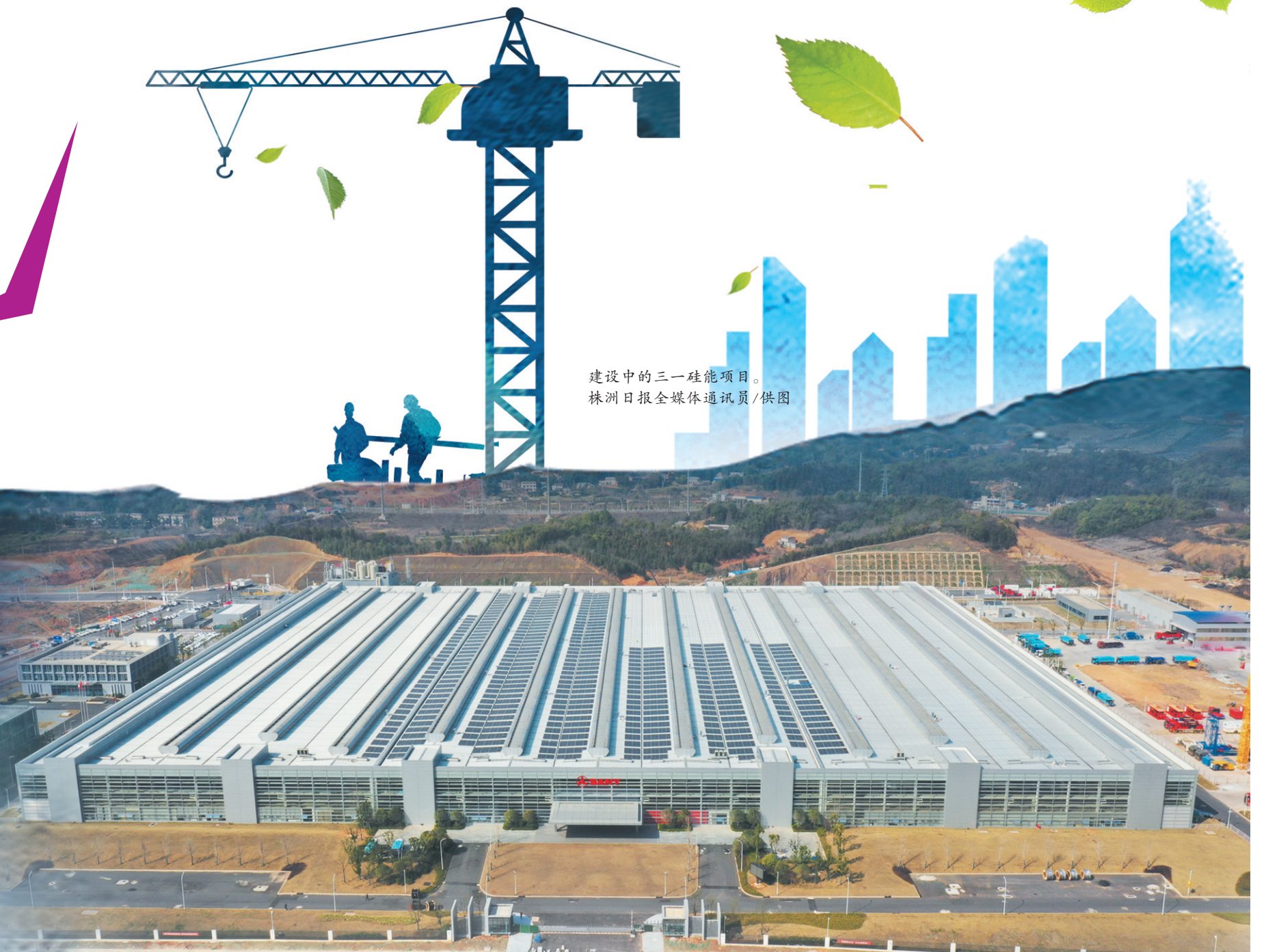
建设中的三一硅能项目。