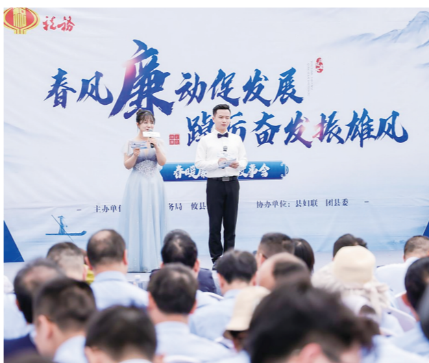
活动现场。

据了解,攸县税务局深挖特色资源,丰富廉洁文化建设载体,注重打造地域性廉洁文化阵地品牌,相继组织开展共写“清廉家书”、清廉主题辩论会等系列活动,并建设党建、税务、廉洁文化为一体的党建长廊,为推进全面从严治党向纵深发展提供重要支撑。